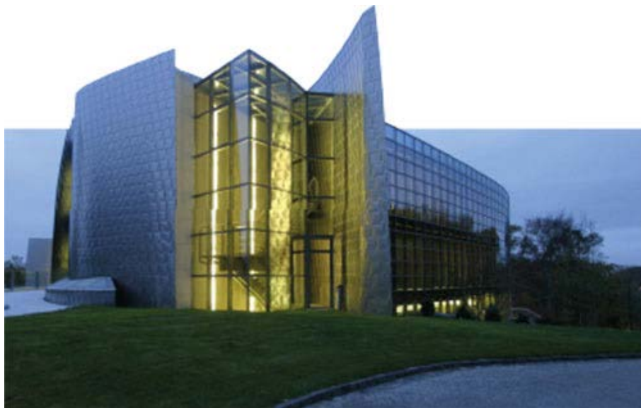
Das Bürogebäude von Fidelity und der FFB in Kronberg im Taunus